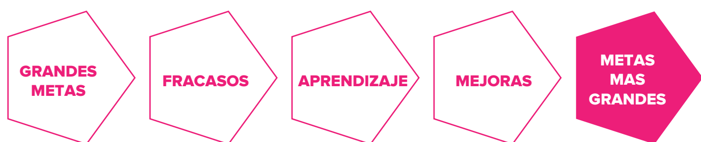
La ruta de Dalio

Ray Dalio, un exitoso empresario estadounidense, fundador del mayor fondo de inversión del mundo, tiene un principio básico acerca del fracaso: "... crear una cultura en la que está bien cometer errores, pero es inaceptable no aprender de ellos."